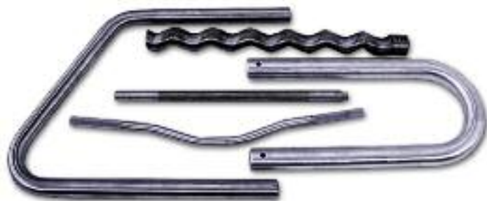
Différents types de formes